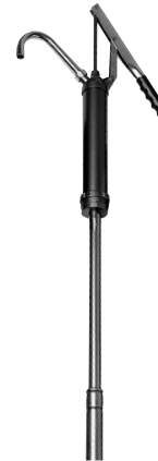
L3000 / L3100